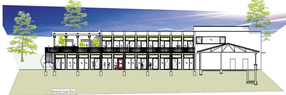
So soll der Umbau der Dachsbergsschule zu einer Kinderkrippe nach den Plänen des Architekturbüro Schattmann vom Hof (linkes Bild) und von der Straße her aussehen. BILD: ARCHITEKTURBÜRO SCHATTMANN

Nachdem die Gemeinde Großrinderfeld kürzlich ELR-Schwerpunktgemeinde wurde, sind hier höhere Zuschüsse zu erwarten und auch aus dem Ausgleichsstock sollen Zuschüsse fließen, so dass man in der Gemeinde nur etwa mit der Hälfte der Summe rechnet, die man selbst aufbringen muss. Die Gemeinderäte waren ebenfalls voll des Lobes und befürworteten die weitere Beauftragung des Architekten.