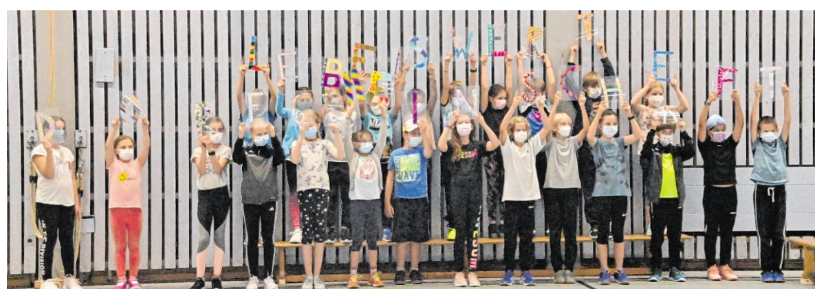
Mit viel Musik, wie hier vom Schulchor der Freiherr von Zobel Grundschule, wurde beim Besuch der Kommission zum Landesentscheid „Unser Dorf hat Zukunft“ in Großrinderfeld gepunktet.

Nun freuen sich alle auf die offizielle Preisübergabe am 20. November in Bühl bei Rastatt. Dort will man mit einer großen Delegation dabei sein und auf Wunsch der Kommission werden auch der Schulchor und „Rentnerblech“ mit von der Partie sein, die mit ihren Liedern den Kommissionsbesuch bereichern hatten.