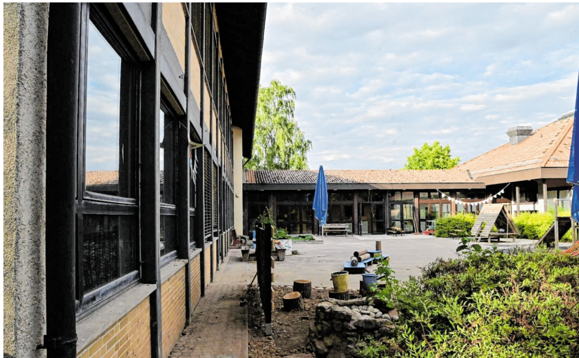
Der ältere Bau der Dachsbergsschule (links) soll zukünftig die Krippe der Kindertagesstätte St. Anna in Gerchsheim aufnehmen. Der neue Teil (rechts) soll Kindergarten bleiben, ebenso wie der verglaste Zwischengang Bestand haben wird.

Die Pläne des Architekten sehen vor, das Dach des alten Schulhauses abzunehmen und mit einem Flachdach zu planen. Dadurch würde der massive Bau nach unten verschwinden und sich besser in die Umgebung einpassen. Während der Bereich für die Kinder über drei Jahren in den jetzt schon genutzten Räumlichkeiten des „Neubaus“ bleibt, wird die Kinderkrippe zukünftig in den umgebauten Altbau ziehen. Diese räumliche Trennung habe viele Vorteile, so Schattmann. Zum einen könnten Kosten gespart werden, weil im neueren Teil des Gebäudekomplexes nur geringe Umbauarbeiten notwendig sind, zum anderen sei auch schon im Altbau vieles